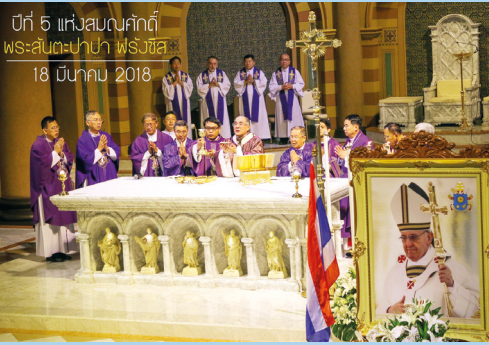
ปีที่ 5 แห่งสมณศกดิ์ พระสันตะปาปา ฟรังซิส 18 มีนาคม 2018