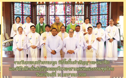
งานวันครอบครัวธรรมทูต พิธีรื้อฟื้นคำสัญญาของสมาชิก และพิธีให้คำมั่นสัญญาตลอดชีพของสามเณรคณะธรรมทูตไทย วันอาทิตย์ที่ 14 มกราคม 2018