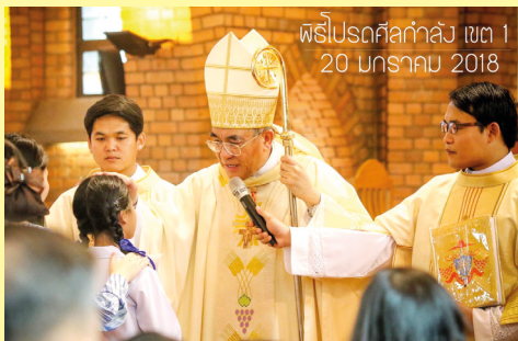
พิธีโปรดศีลกำลัง เขต 1 20 มกราคม 2018

วันเสาร์ที่ 3 กุมภาพันธ์ 2018 พระคาร์ดินัล เกรียงศักดิ์ โกวิทวาณิช เป็นประธานพิธีมิสซาวันนักบวชสากล อัครสังฆมณฑลกรุงเทพฯ และเสกเทียน ในวันฉลองการถวายพระกุมารในพระวิหาร ณ วัดนักบุญยอห์นบอสโก กรุงเทพฯ ในงานมีการบรรยาย หัวข้อ 350 years of mission in Siam and religious involvement and mission หลังมิสซาจับประทานอาหารร่วมกัน